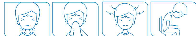
Mal de gorge