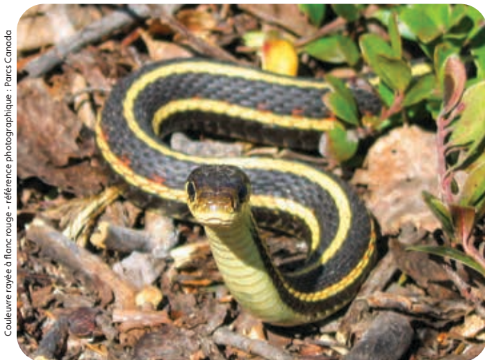
Couleuvre rayée à franc rouge

La Loi sur les espèces en péril (TNO) prévoit un processus pour identifier, protéger et rétablir les espèces en péril aux TNO. La Loi s'applique à toute espèce sauvage animale ou végétale qui est gérée par le gouvernement des Territoires du Nord-Ouest. En autres, elle s'applique dans la plupart des régions des TNO, tant sur les terres publiques que sur les terres privées, y compris les terres privées visées par un accord de revendications territoriales.